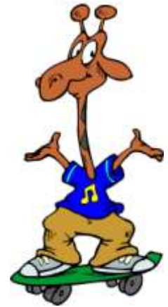
GoFor(F)it logo Kinderfysiotherapie